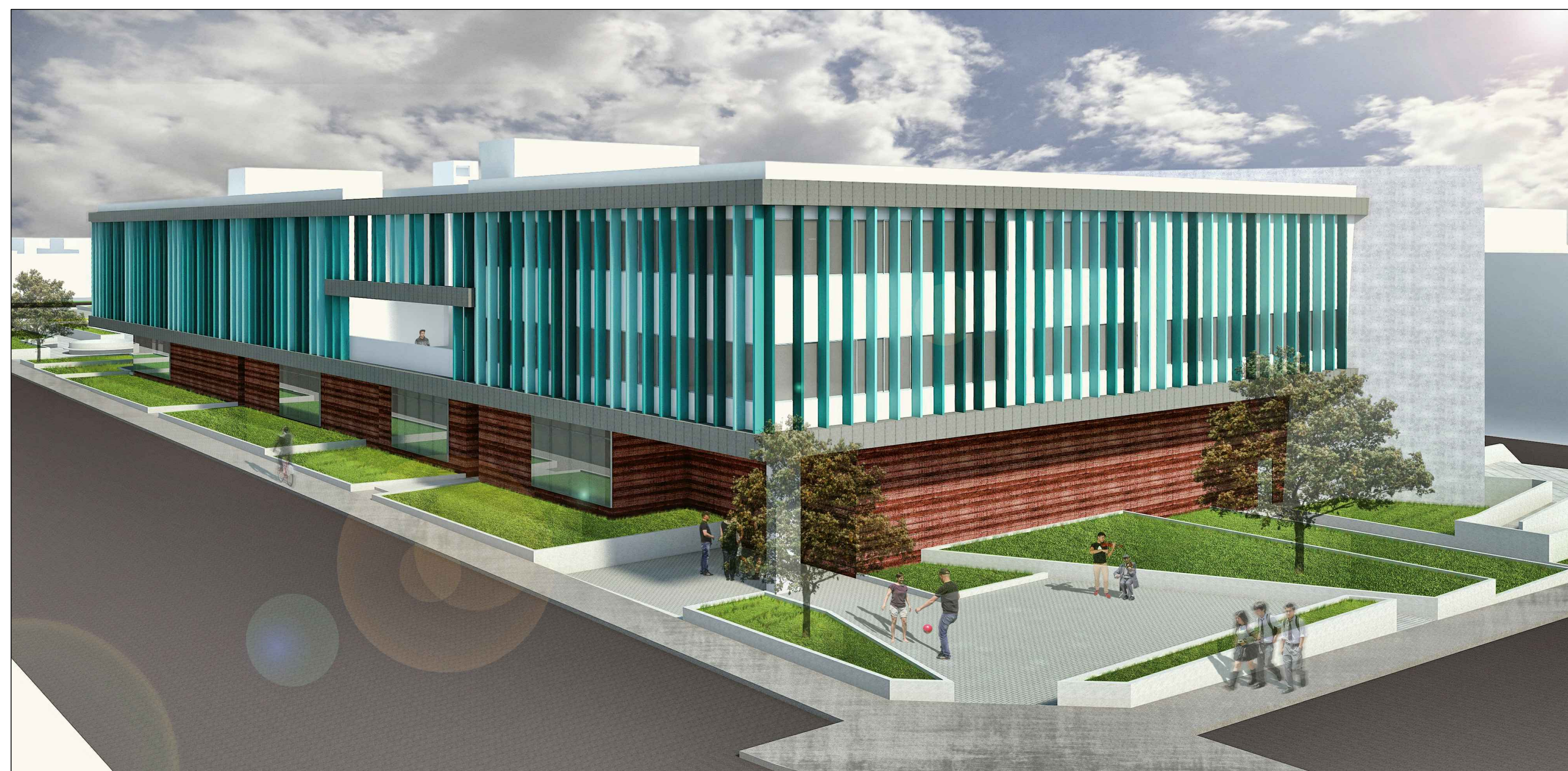
VISTA AÉREA - CALLE LOS ARTESANOS CON CALLE LOS EBANISTAS