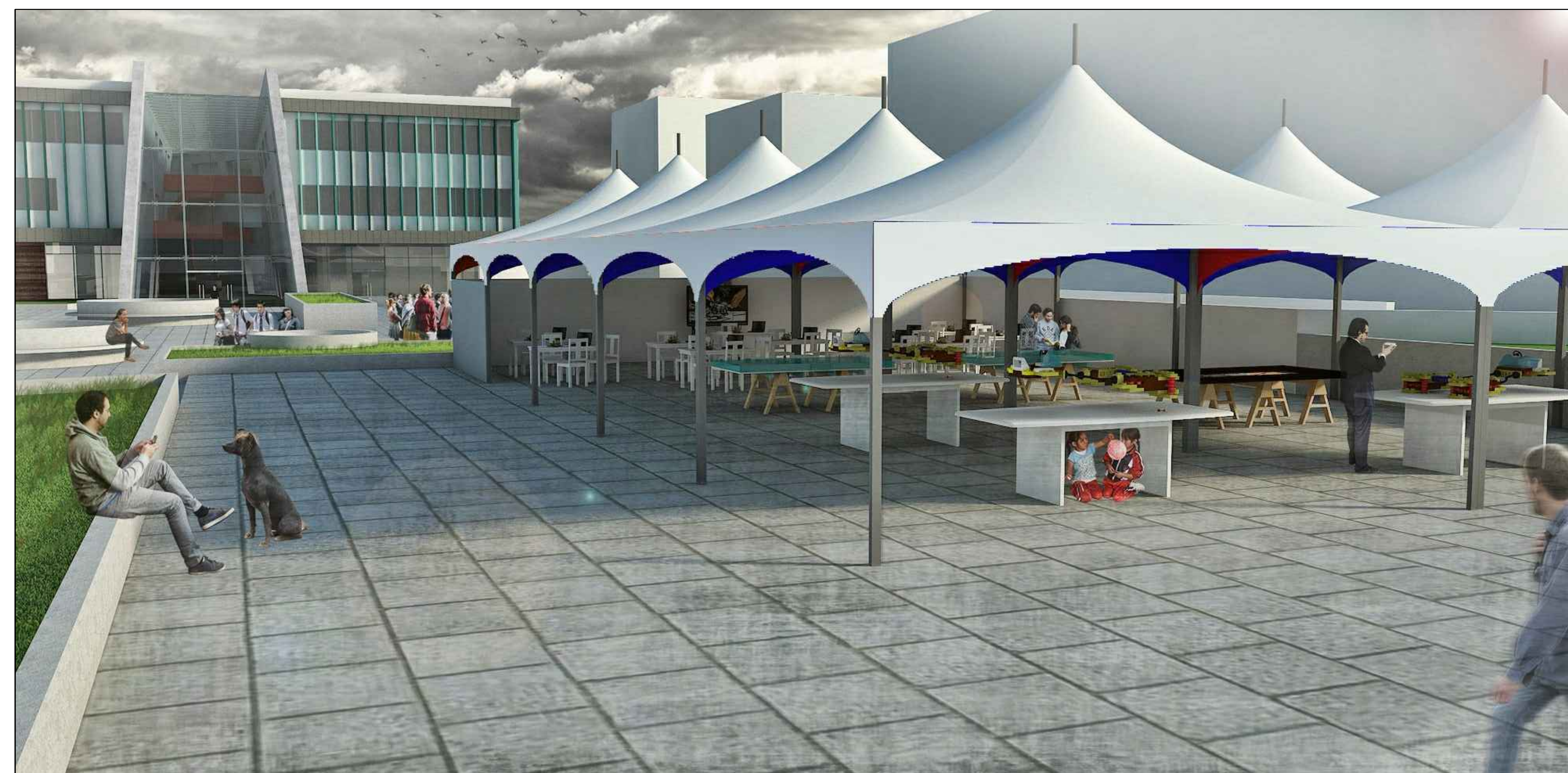
EXPLANADA CON FERIA TEMPORAL