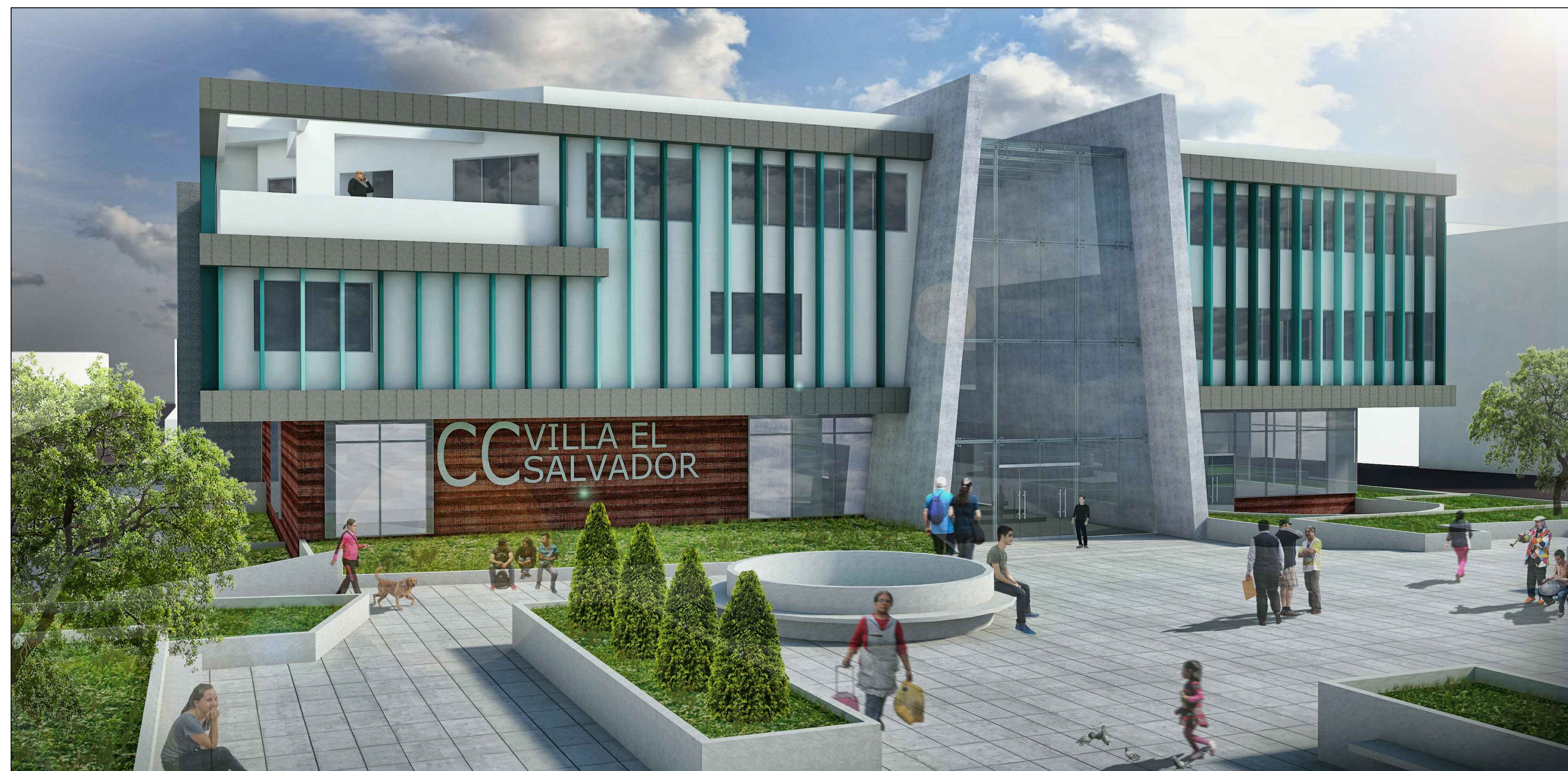
FACHADA PRINCIPAL DEL CENTRO CULTURAL