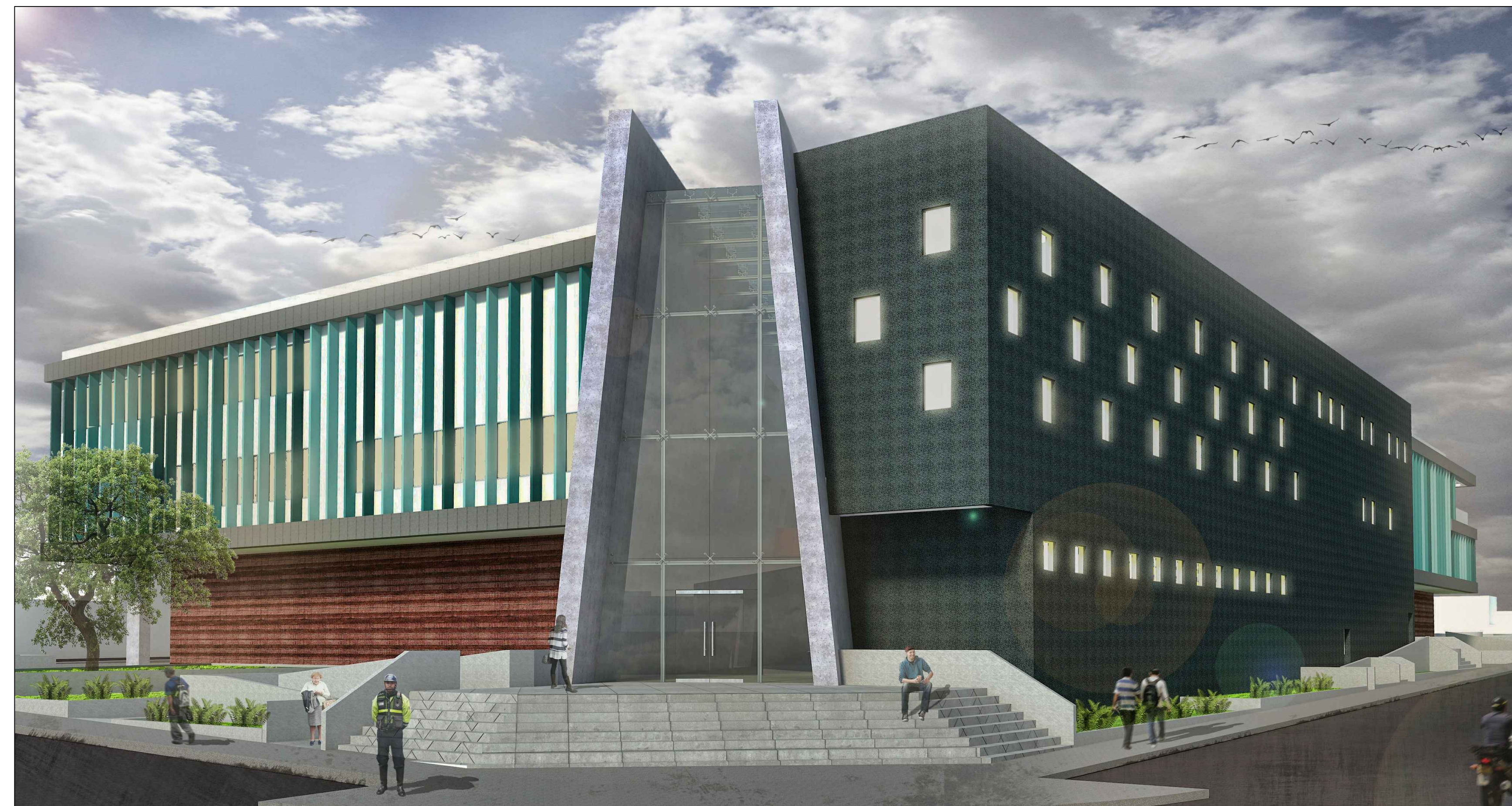
INGRESO POSTERIOR DEL CENTRO CULTURAL