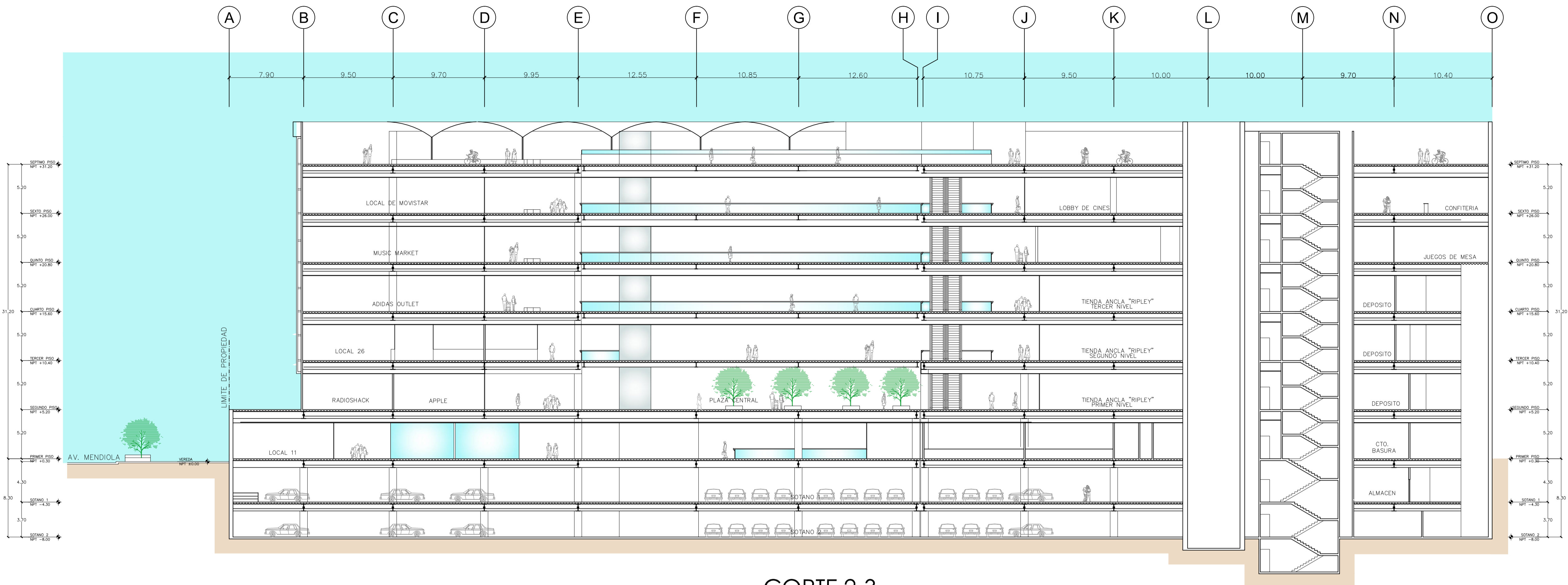
CORTE 2-3 ESCALA : 1/250