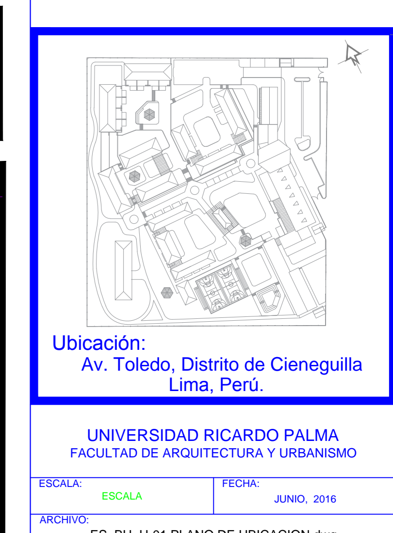
Ubicación: Av. Toledo, Distrito de Cieneguilla Lima, Perú.