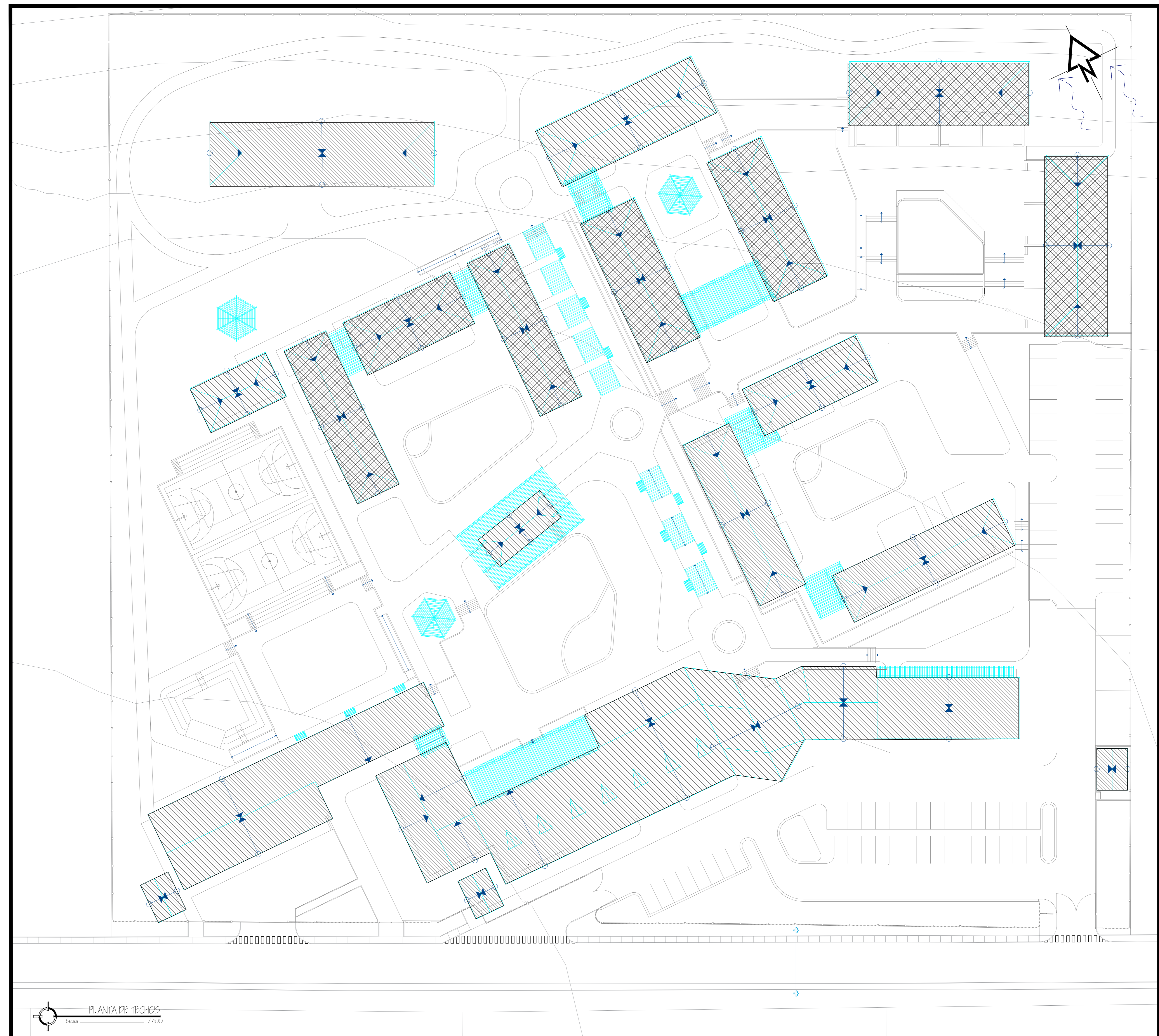
PLANTA DE TECHOS 1/400