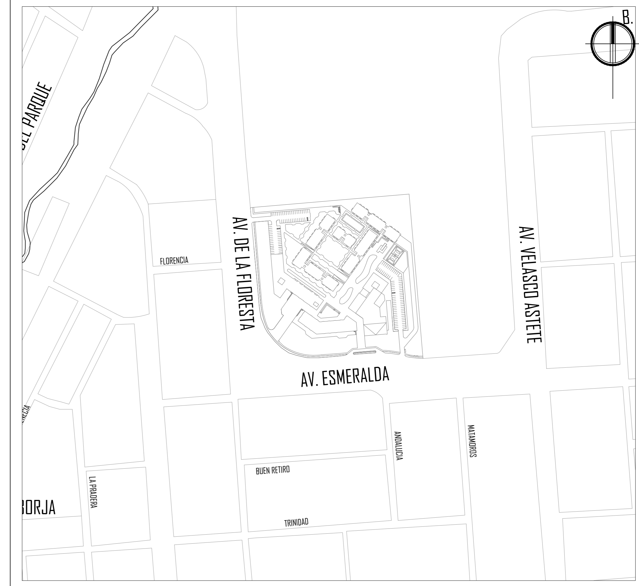
Plano de Sector ESCALA 1/2000