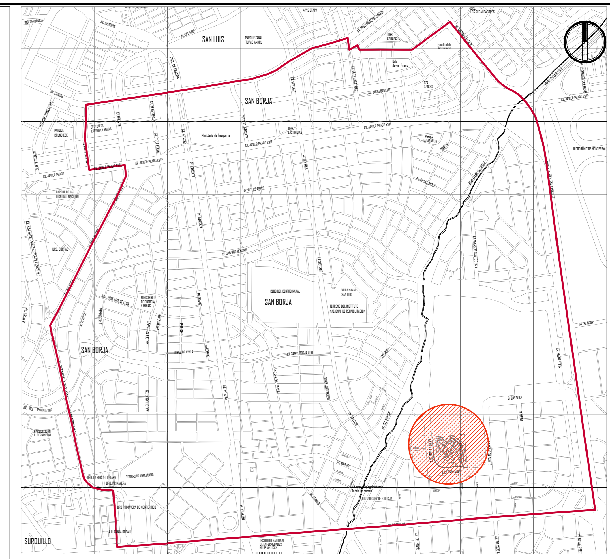
Mapa de Distrito: San Borja ESCALA 1/20000