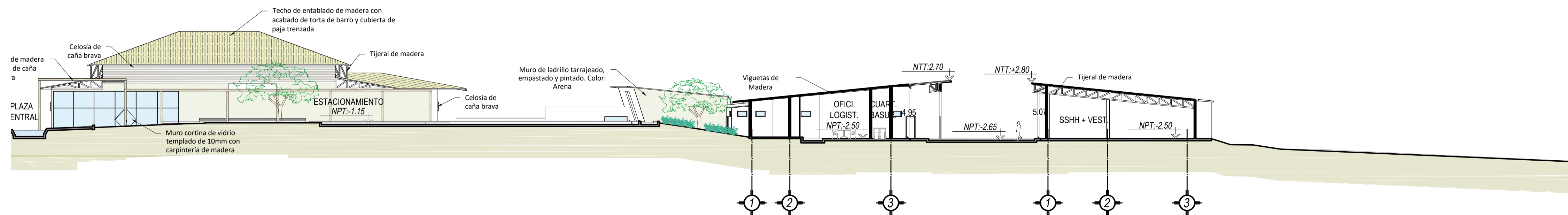
CORTE B-B: TRAMO 2 Escala: 1/250