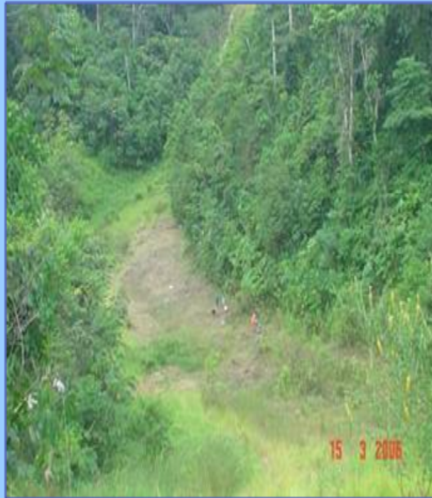
Asentamiento diferencial sobre el ducto por saturación de suelos