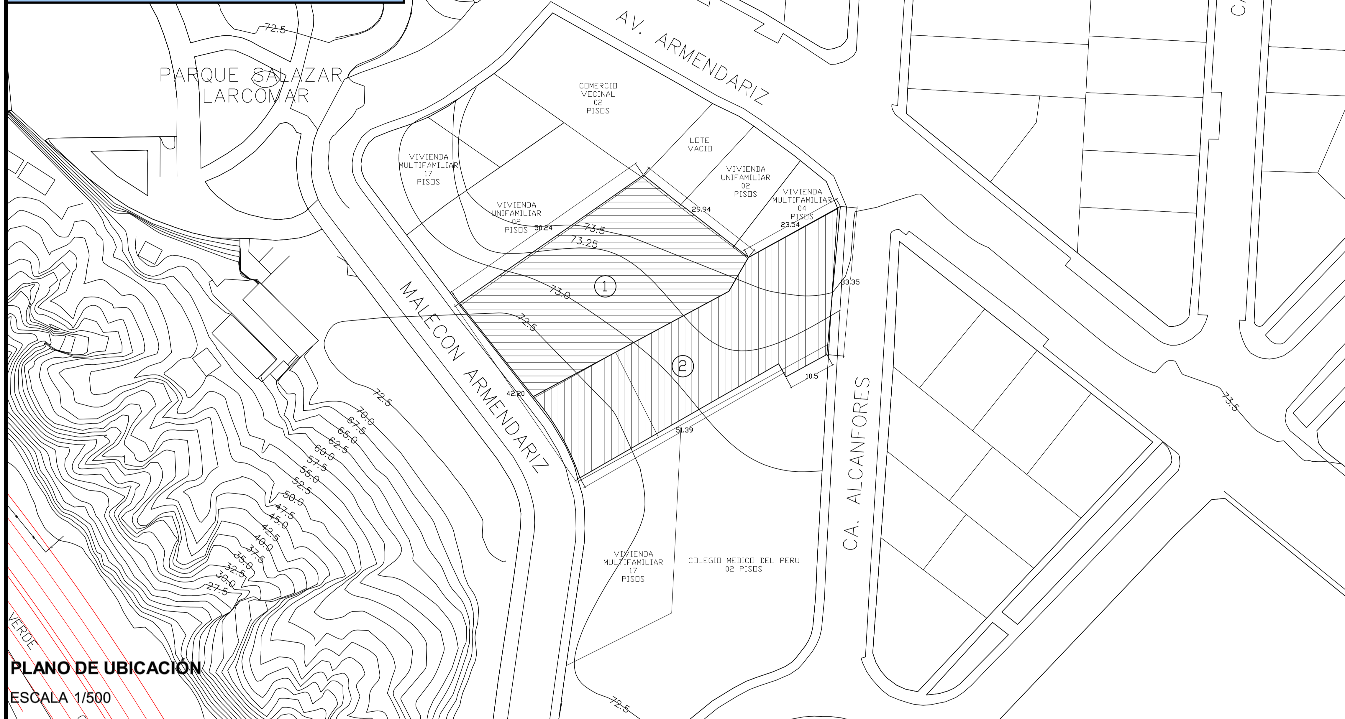
PLANO DE UBICACIÓN ESCALA 1/500