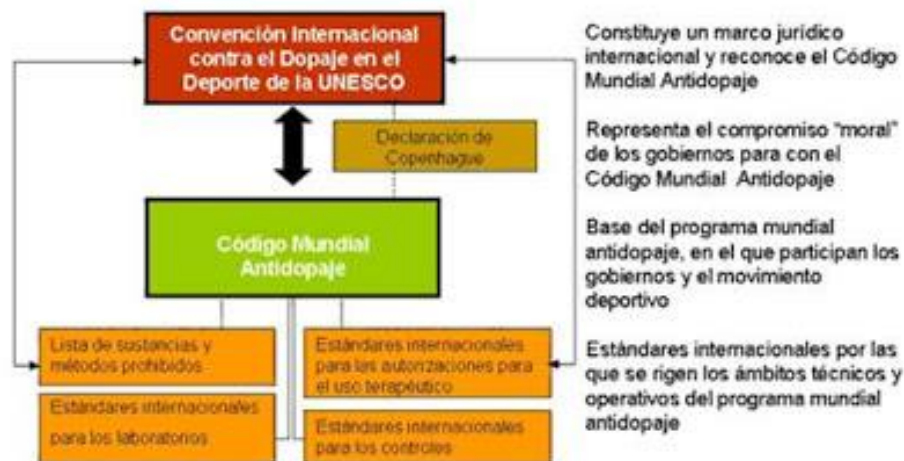
CUADRO 3: Esquema y estructura del código mundial antidopaje

Se está en constantes implementaciones y modificaciones por eso los países deben estar pendientes de este. Es el documento central que proporciona el marco para políticas, normas y reglamentos antidopaje para las organizaciones deportivas y Estados. Su fin primordial es que todo el mundo goce de una competición segura y justa en igualdad de condiciones.