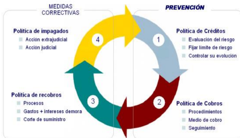
Figura 4. Principios de Administración Financiera – La Cobranza