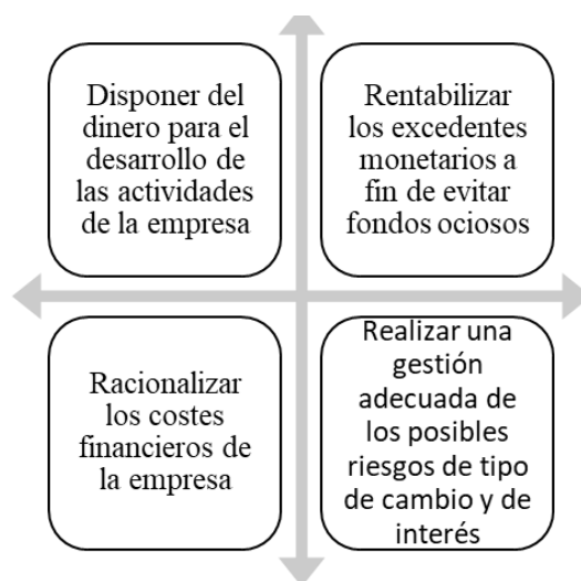
Figura 1. Objetivos de la Tesorería

Es fundamental indicar que, para conseguir los objetivos antes mencionados, toda empresa debe precisar las funciones que serán encomendadas al tesorero, aliado importante para el desarrollo de las tareas diarias con objeto de asegurar el cumplimiento de las obligaciones de pago inmediatas. El tesorero es responsable del control y planificación de la liquidez a través del análisis del flujo de caja y presupuesto de tesorería, gestionar las