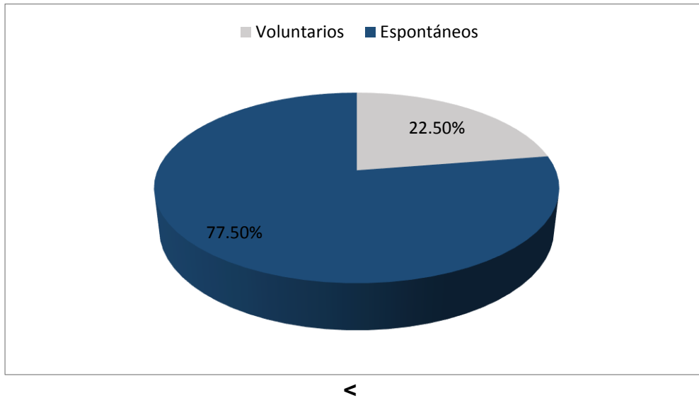
Gráfico 1. Prevalencia de abortos voluntarios en pacientes que desarrollaron alteraciones psicológicas

con al menos un hijo en comparación a las pacientes que no tuvieron hijos. Esta asociación es estadísticamente significativa por ser mayor a 1.