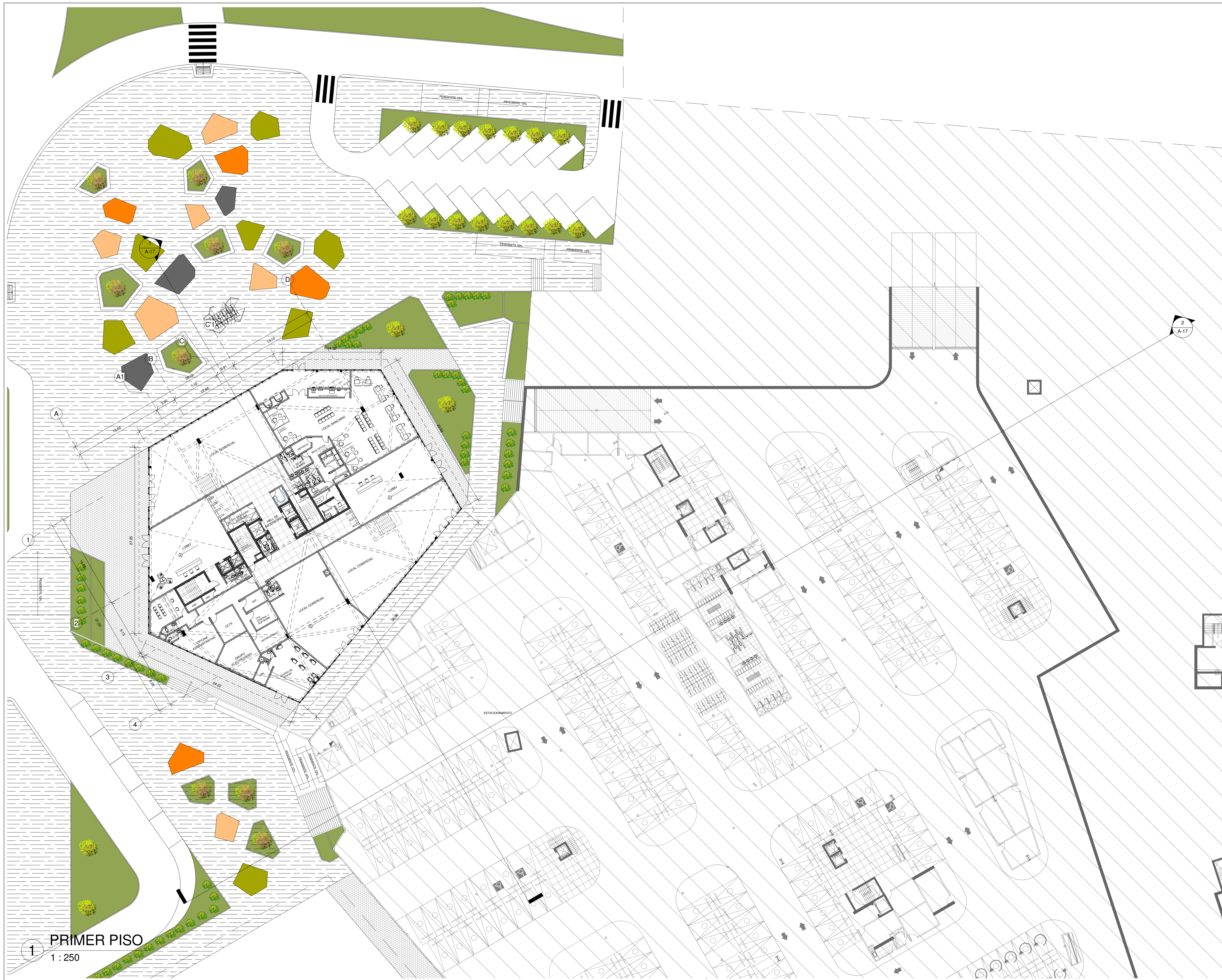
PRIMER PISO 1 : 250