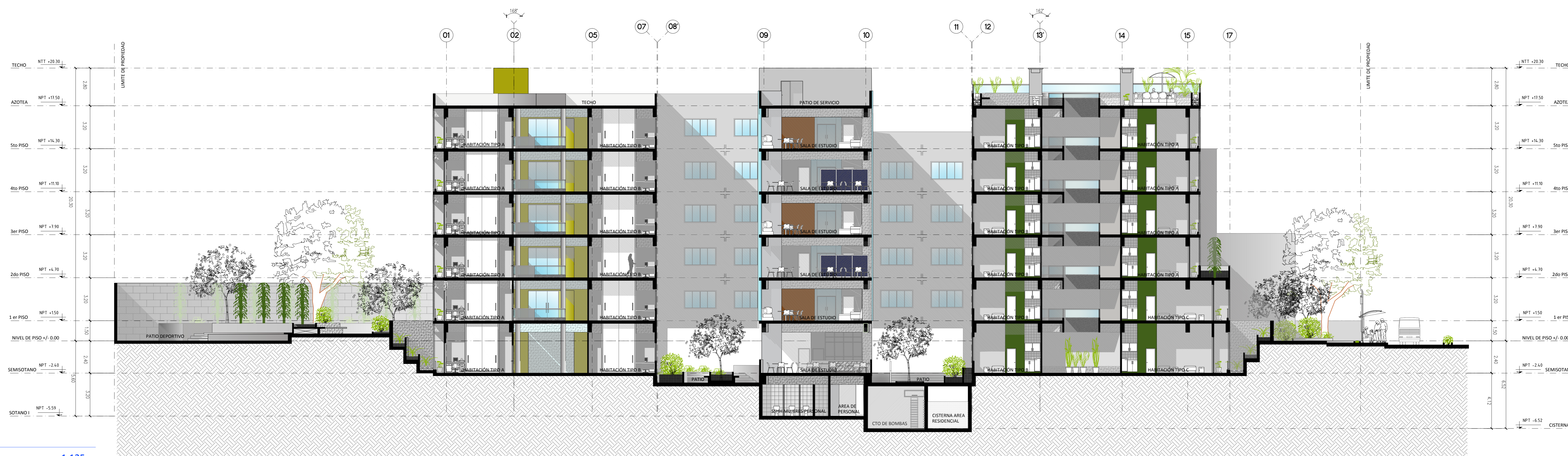
CORTE GENERAL A-A 1:125