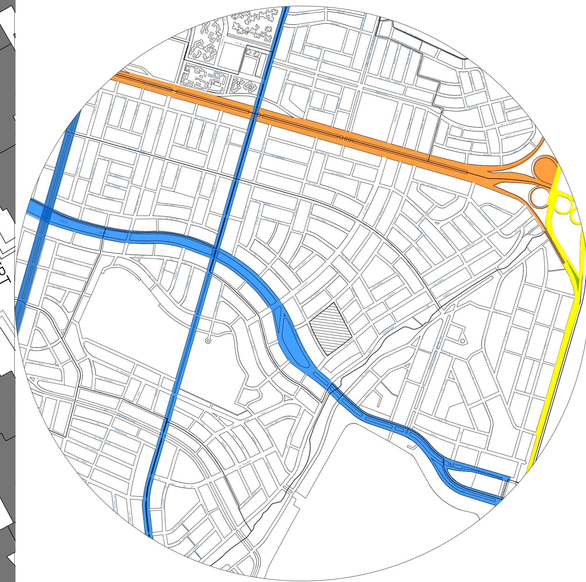
ESQUEMA VIAL ESCALA: 1/10000