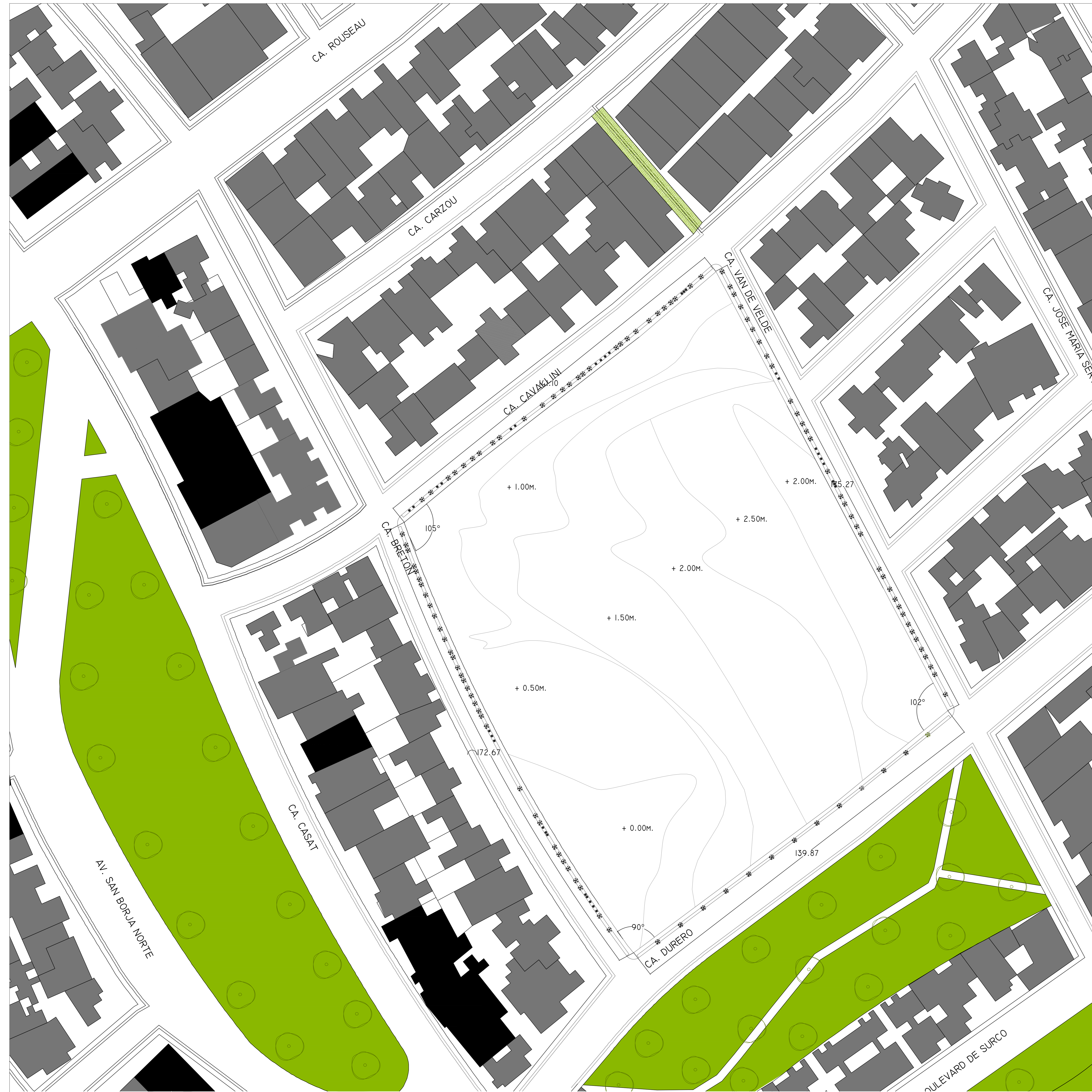
PLANO DE MORFOLOGIA URBANA ESCALA: 1/500